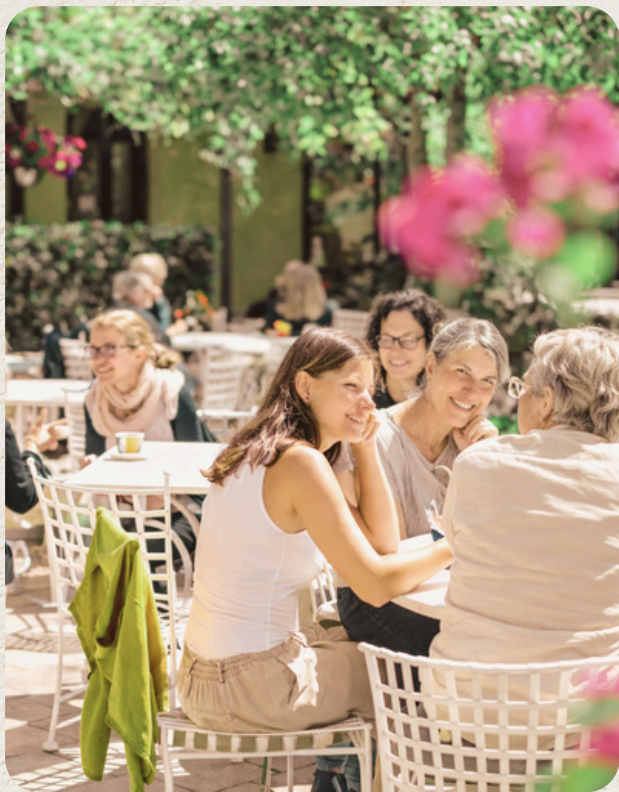
FOTO IMPRESSIES VAN DE TAALSCHOOL